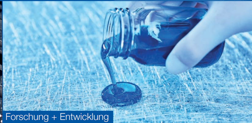
Forschung + Entwicklung