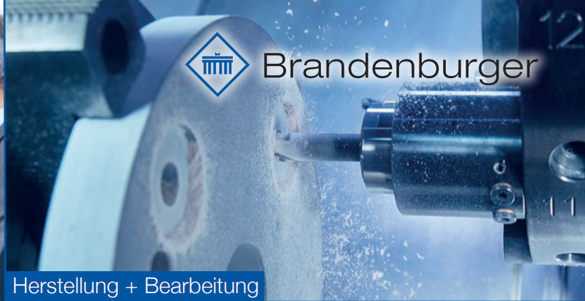
Herstellung + Bearbeitung