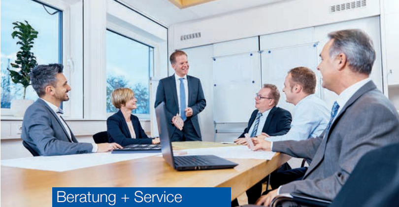
Beratung + Service