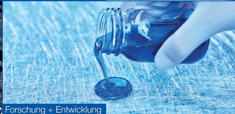
Forschung + Entwicklung