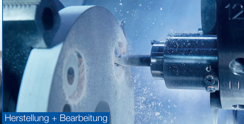
Herstellung + Bearbeitung