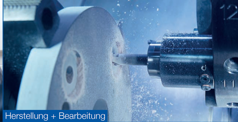
Herstellung + Bearbeitung