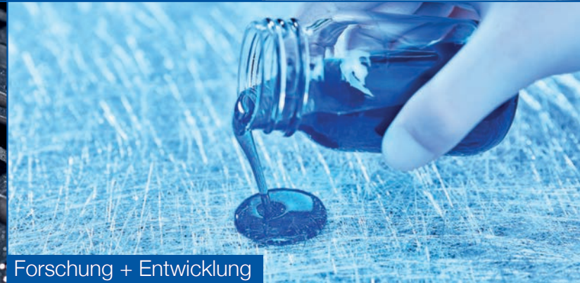
Forschung + Entwicklung